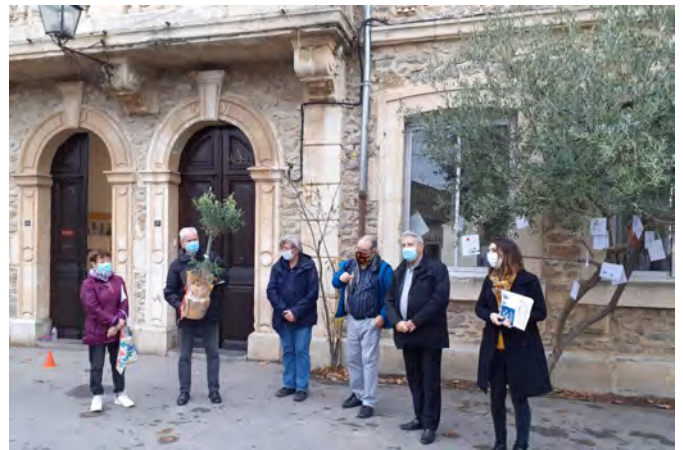
Remise des prix en présence de Monsieur le Maire