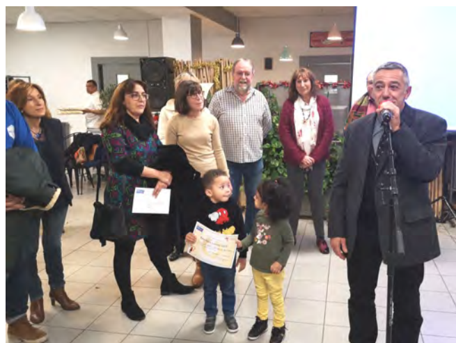
Remise des prix en présence de Monsieur l'Inspecteur de l'Education nationale