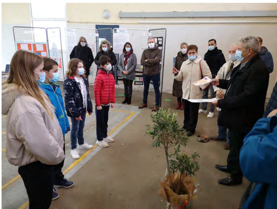
Remise des prix aux enfants en présence des adjoints au Maire