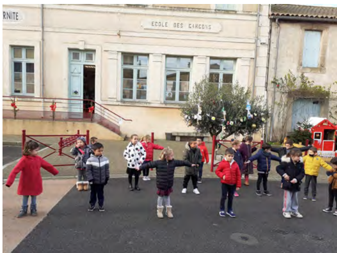
Flash-mob « Liberté - Egalité - Fraternité »