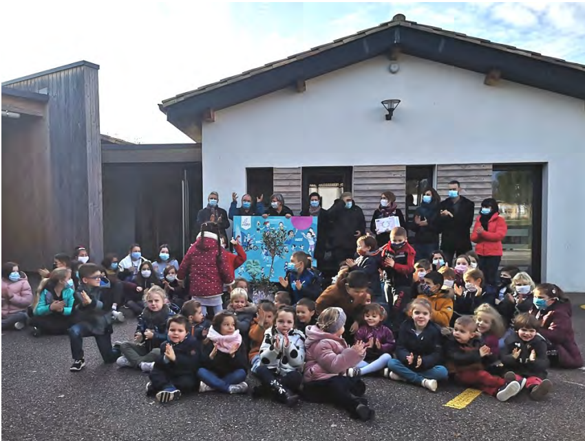
Remise des prix en présence de Monsieur le Maire

Lien avec les DDHC (débat, discussions philosophiques, productions d'écrits, arts visuels).