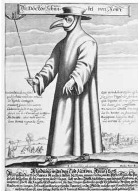
Un « Corbeau », médecin peste. Gravure allemande de 1656.

les motivations des autorités sont ambiguës. Ainsi, en 1630, la municipalité d'Angers prétexte la peste pour expulser des comédiens « avec défense de jouer en icelle ville ». En fait, une « émotion populaire » fait rage depuis plusieurs jours. Suscitant l'attroupement, tout spectacle renforcerait le désordre. En revanche, les processions sont rarement interdites. Et telle ou